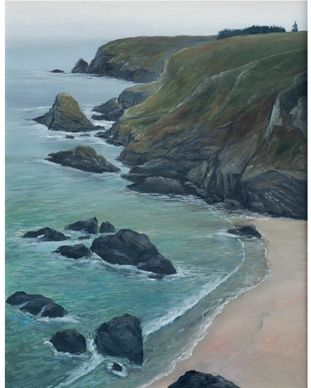
“Plage isolée”, 32x24cm, oil/wood

www.dhaudrecy-art-gallery.com · dhaudrecy@skynet.be