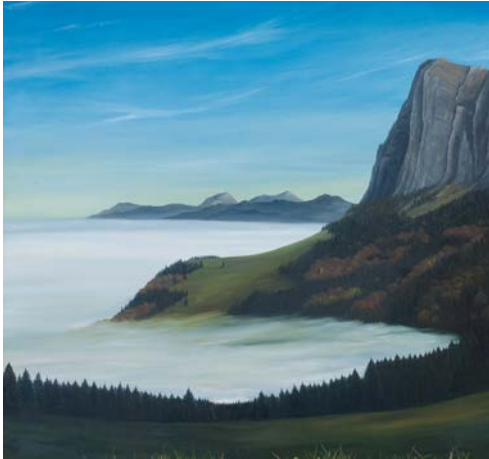
“Sous les nuages, le lac”, 100x100cm, oil/wood

« Les espaces où je me promène ne sont pas seulement ruraux et physiques , ils sont aussi culturels, historiques, liés à l'histoire de la peinture dans une tradition du paysage occidental, ainsi que mentaux.